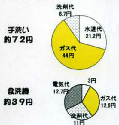
■1回当たりのランニングコストの比較