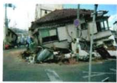
平成7年度版「警察白書」より

今年の東北地方を襲った岩手・宮城内陸地震では地震加速度が4Gでした。スペースシャトルの打ち上げ時で約3Gの加速なのでこの地震の凄まじさが分かります。このように地震発生時は、逃げることもままならないわけです。