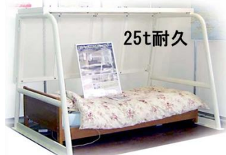
¥340,000(税別) フジワラ産業(株)