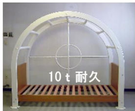
¥200,000(税別)(株)ニッケン 鋼機