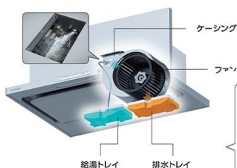
(リクシル・クリナップ)